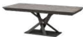
MISTRAL Table REF. 5071 EP 491F · AC 680