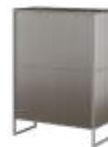
TERRA Highboard REF. 10101 EP 2467F · DC 701 · W 2467