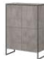
TERRA Highboard REF. 1010 EP 491F · AC 680