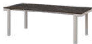
LUCIA Table REF. 5076 EP 2462F · DC 701