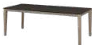
ILEX Table REF. 5066 RO 570 · EP 2464F · CC 634