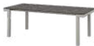
LUCIA Table REF. 5076 EP 2464F · CC 635