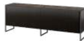
TERRA Sideboard REF. 10071 EP 2471F · DC 704 · W 2407