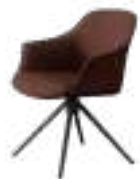
KEDUA Chair REF. 4065 EP 2471F · ENI 91