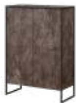
TERRA Highboard REF. 1010 EP 2471F · DC 704