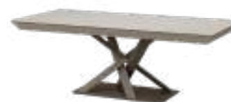
MISTRAL Table REF. 5071 EP 2487F · EP 492F · CC 633