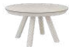
ESLA Table REF. 5010 EP 2463F · DC 703