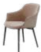
KEDUA Chair REF. 4062 EP 491F · LTN 02 · MYS 252