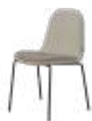
GALET Chair REF. 412202 EP 2407F · LIB 05 · LIB 10