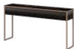
TERRA Console REF. 10141 EP 2486F · DC 701 · W 2471