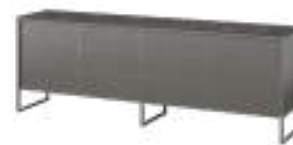
TERRA Sideboard REF. 100710230 EP 2464F · CC 635 · W 2464