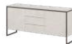
TERRA Sideboard REF. 1006020 EP 2407F · DC 703