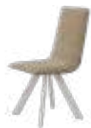
VULCANO Chair REF. 144 EP 2462F · MOU 62