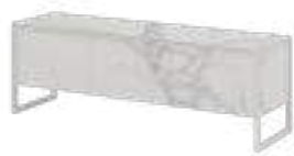
TERRA Tv REF. 1001 EP 2462F · AC 301