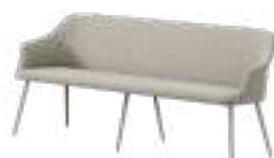
KEDUA Bench REF. 406021 EP 2487F · CRE 51