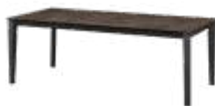
ILEX Table REF. 5066 RO 559 · EP 2471F · DC 704