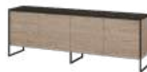
TERRA Sideboard REF. 10073 EP 491F · CC 634 · RO 570